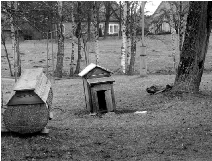
Anykščių miesto parko rekonstrukcijai tikimasi gauti Europos Sąjungos finansavimą.

Rajono vadovai tikisi iš ES struktūrinių fondų gauti finansavimą Anykščių miesto parko sutvarkymui. Paraiška struktūriniam fondams turėtų būti apteikta dar šiais metais. O šiuo metu yra rengiamas miesto parko projektas.