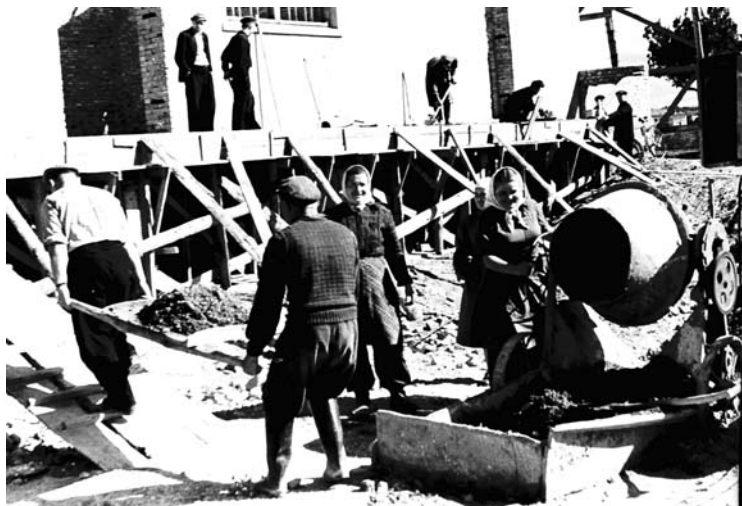
1957 m.: statomas dviaukštis gyvenamasis namas J. Biliūno gatvėje, šalia „Anykštos“ parduotuvės. Foto JBgatvė-1957 Izidoriaus GIRČIO nuotr.

1952-1957 metais leistame „Kolektyviniame darbe“ svarbiausia tema – sėjos darbai. Tačiau 1952-1955 metais galima rasti ir tekstų, kuriuose rašoma apie statybas. Tiek pastatų, tiek komunizmo. Vėliau, 1956-1957 metais šių temų beveik nerasta, laikraštis pasikeičia, atsiranda daugiau nuotraukų, karikatūrų. Šįkart skaitytojams pateikiame ano metų statybines aktualijas, taip pat kviečiame akis paganyti į tuometines karikatūras bei satyras.