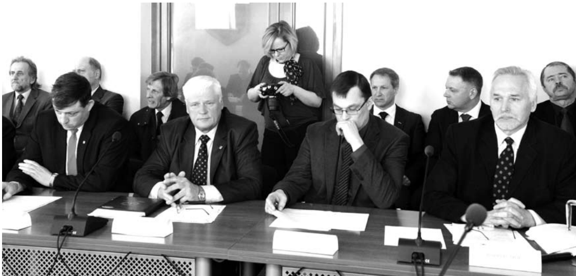
Socialdemokratai nuo šiol bus didžiausiais rajono valdžios kritikais.