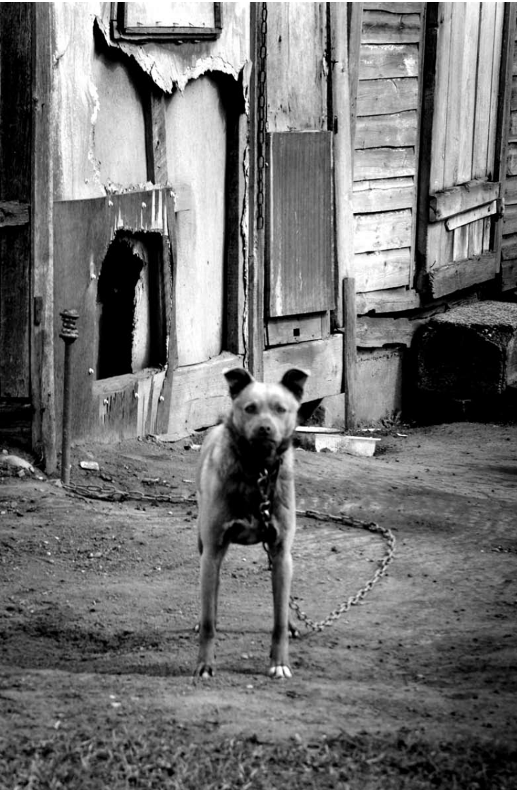
Šeimnininko jis nebesulauks, vargu, ar greitai sulauks ir šeimninkės...