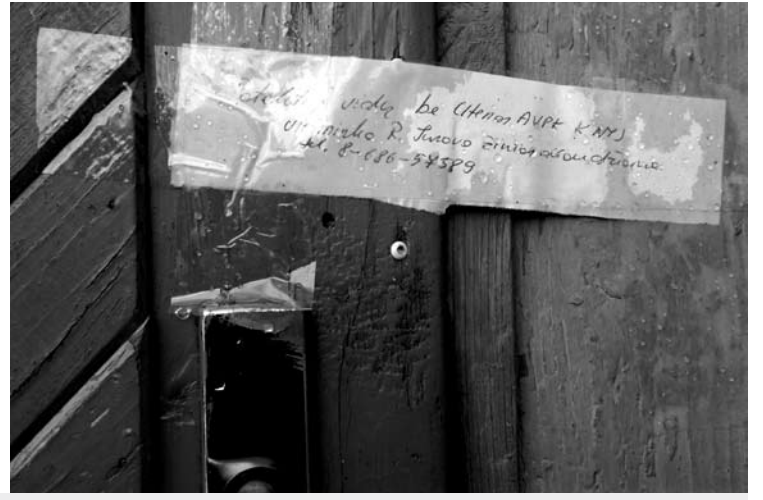
Šiame Kavarsko name ketvirtadienį liejosi kraujas – įvyko antroji šiais metais žmogžudystė Anykščių rajone. Namų pusė, kur įvyko nusikaltimas, užantspauduota policijos.