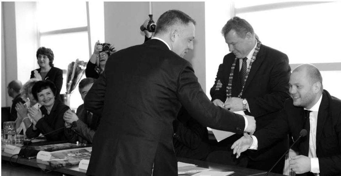
Į Anykščius pasveikinti savivaldos rinkimus laimėjusios Lietuvos Respublikos Liberalų sąjūdžio komandos atvyko partijos pirmininkas Eligijus Masiulis.